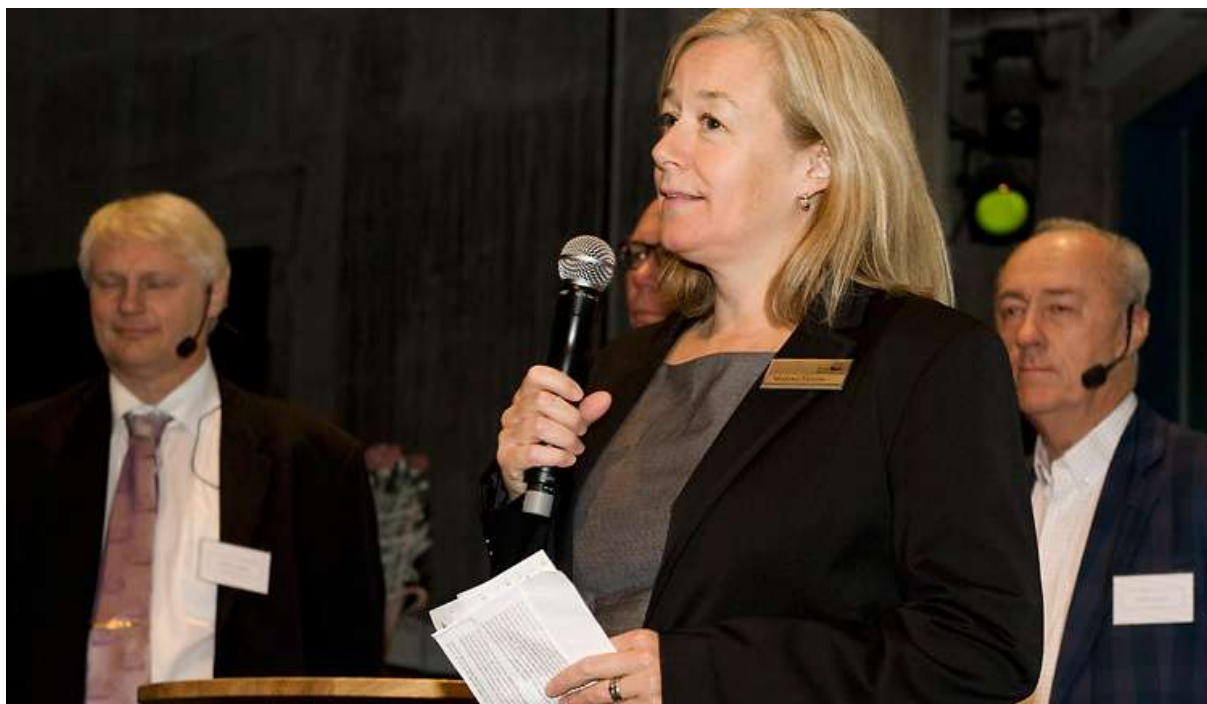
Foto från CEMAS invigning